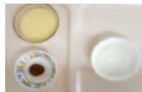
練習食B（全粥・豆腐）