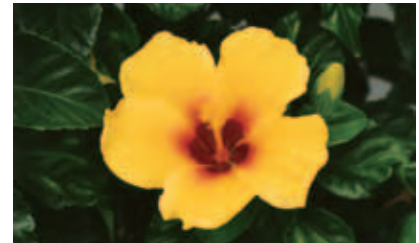
ハイビスカス 花言葉:輝き

検索願いが提出されていない状態で保護された場合でも、早期にご家族への連絡が可能となります。