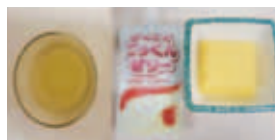
練習食A（ゼリー・豆腐）